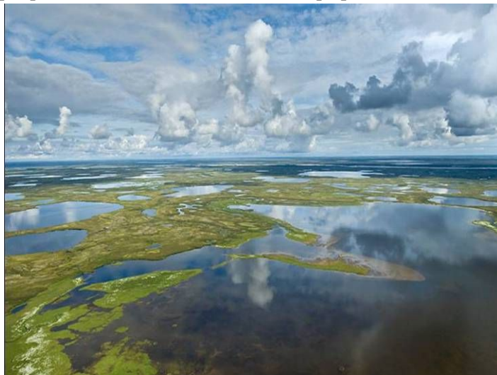
Рис.4. Сибирская Индия – Беловодье –Лукоморье.

В этом заключается ещё одна тайна Лукоморья – оно находится в сибирской Индии.