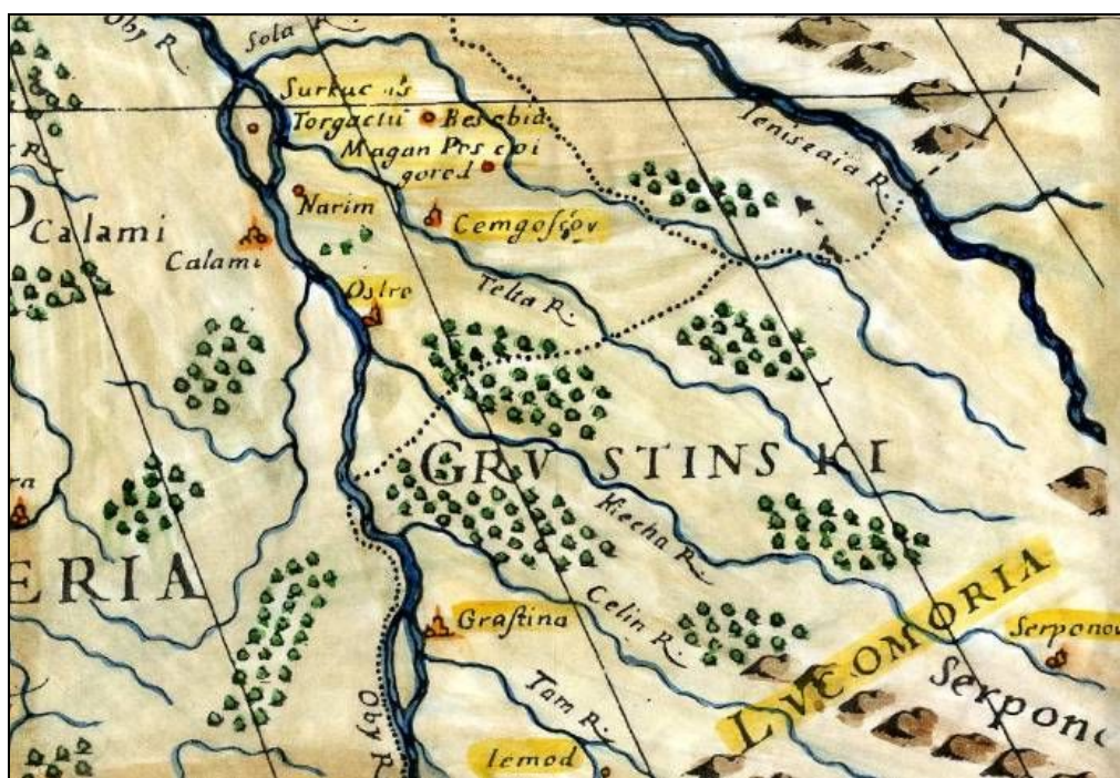
Рис.2. Копия фрагмента карты Московия Гийома Сансона, 1688 г.

Наиболее согласно с текстом Югорского Дорожника Лукоморье нанесено на географических картах французского королевского картографа Гийома Сансона (Атлас 1688г.) (рис. 2).